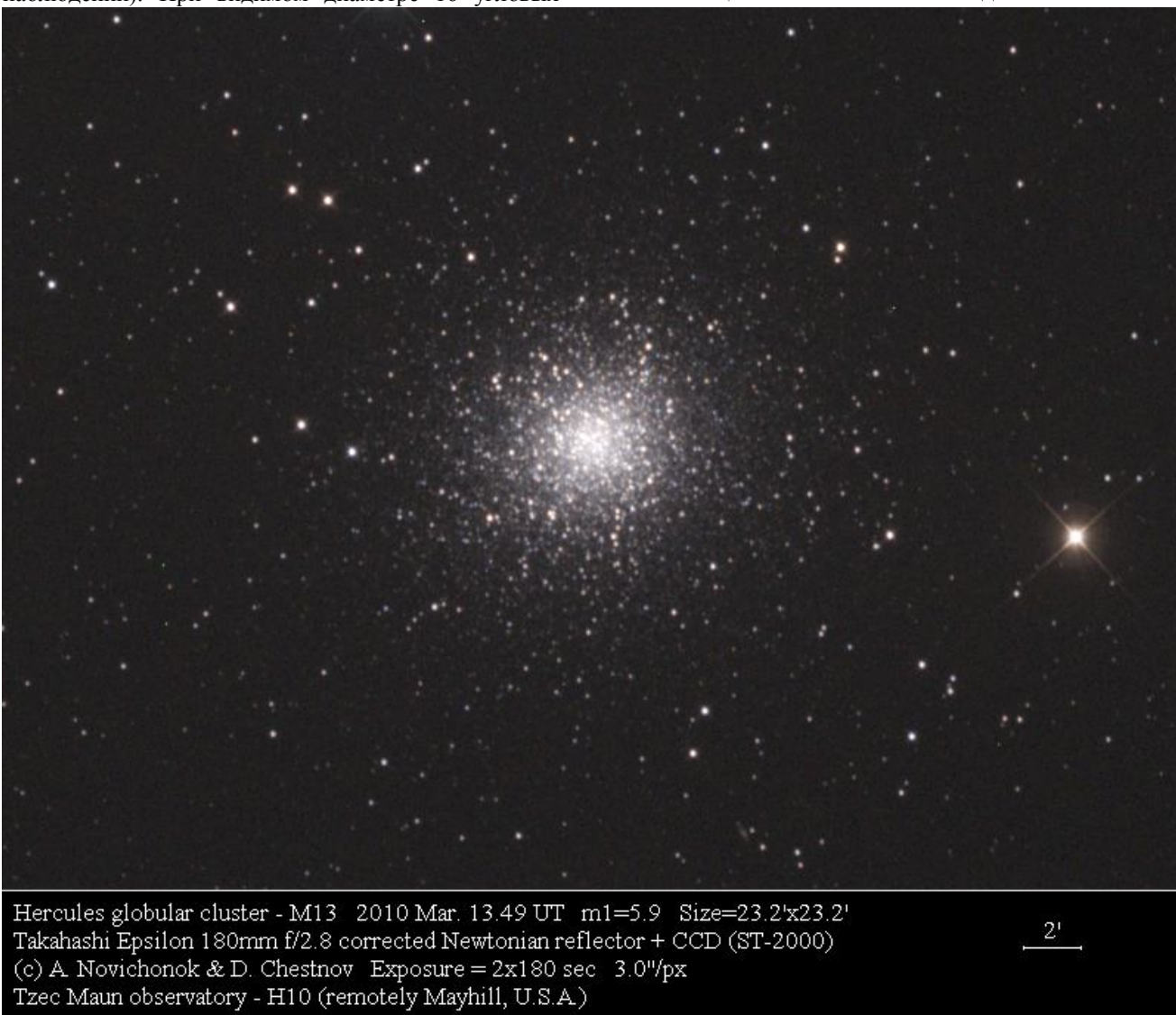
Hercules globular cluster - M13 2010 Mar. 13.49 UT m1=5.9 Size=23.2'x23.2' Takahashi Epsilon 180mm f/2.8 corrected Newtonian reflector + CCD (ST-2000) Exposure = 2x180 sec 3.0"/px Tzec Maun observatory - H10 (remotely Mayhill, U.S.A.)