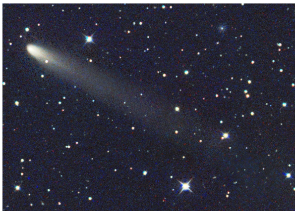
© М. Егер (Австрия), 10 сентября 2012 г.

В текущем появлении комета относительно легко доступна для визуальных наблюдений, на снимках же она демонстрирует великолепный хвост длиной несколько угловых минут, который можно различить визуально при использовании очень больших телескопов.